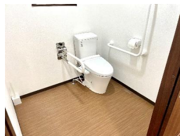
【車いすも入れるトイレ】