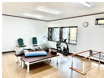
【トレーニングスペース】